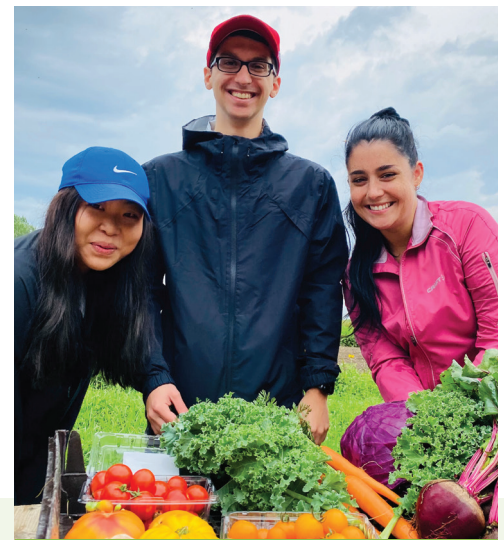
Les bénévoles du programme Adoptez une récolte avec leur récolte.

Au total, nos participants au programme Adoptez une récolte ont effectué 1 800 heures de bénévolat à la ferme pendant la saison de croissance. Un grand MERCI à tous ceux qui se sont impliqués !