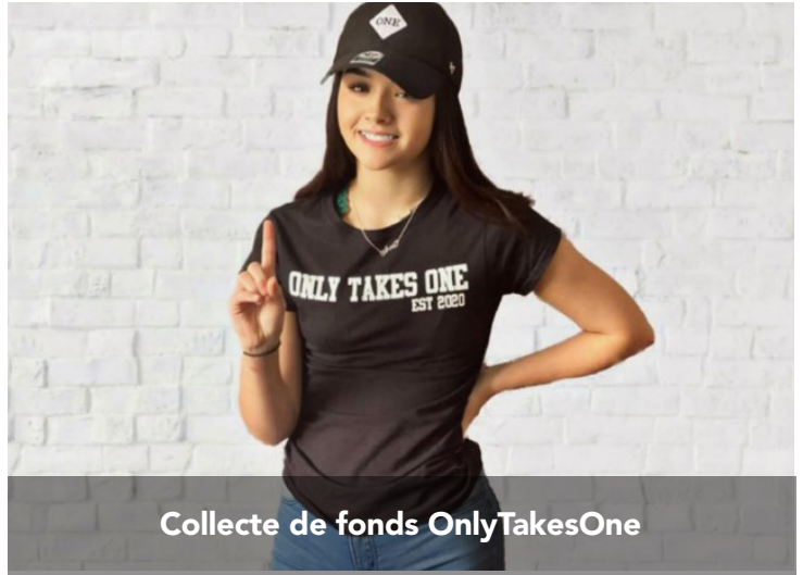
Collecte de fonds OnlyTakesOne