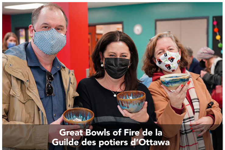
Great Bowls of Fire de la Guilde des potiers d'Ottawa