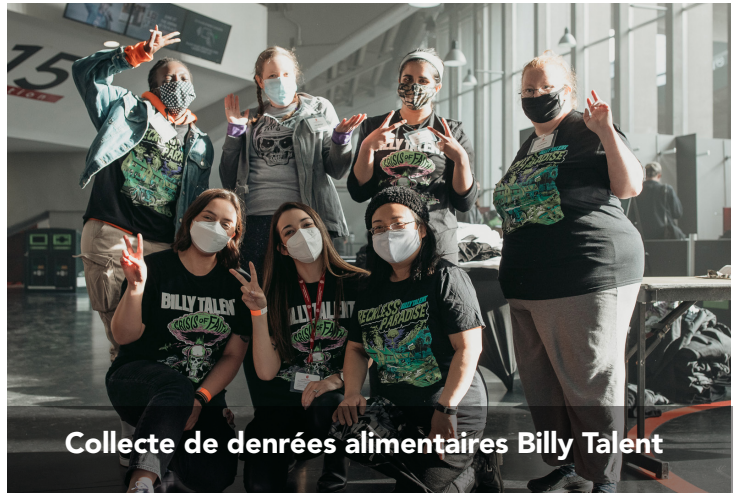
Collecte de denrées alimentaires Billy Talent