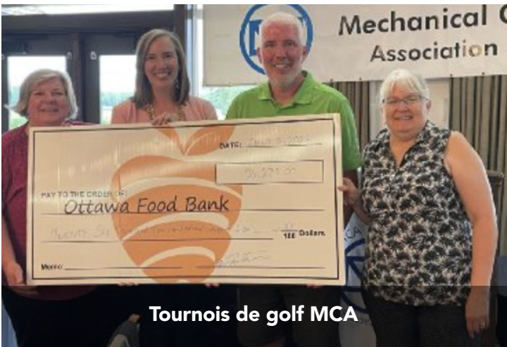
Tournois de golf MCA