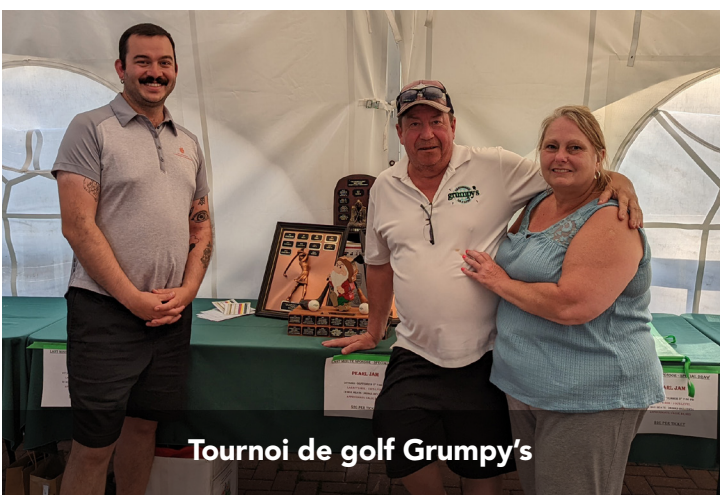
Tournoi de golf Grumpy's